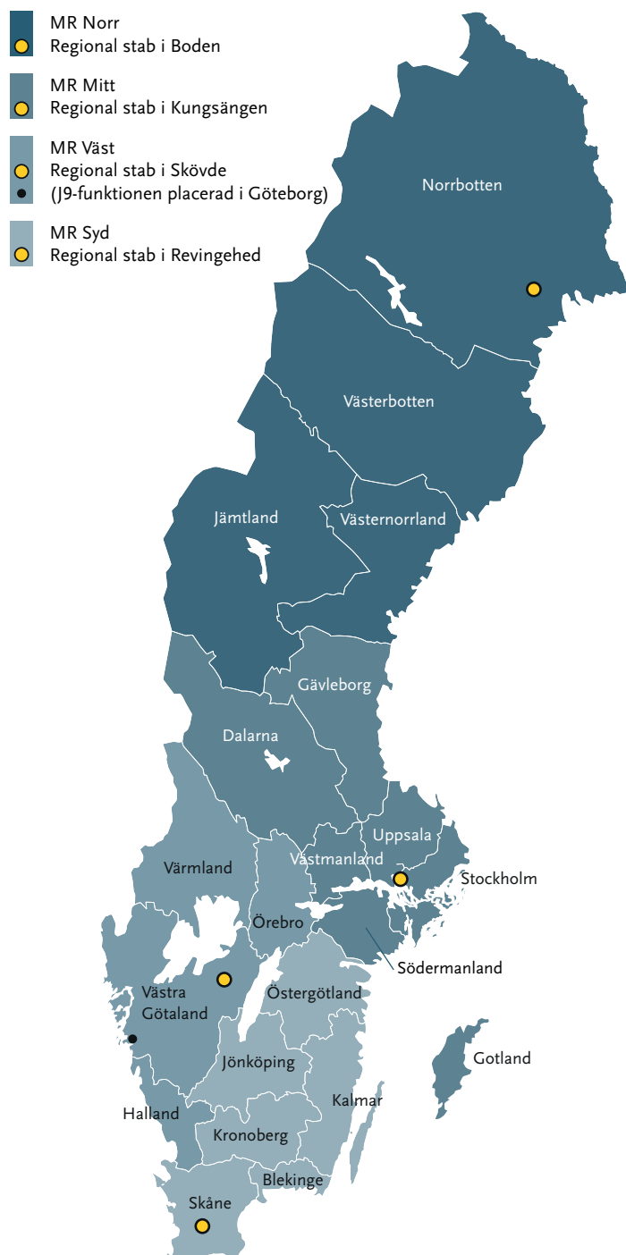
Figur 3 Sverige indelat i fyra militärregioner (MR); MR Norr, MR Mitt, MR Väst och MR Syd; och 21 län